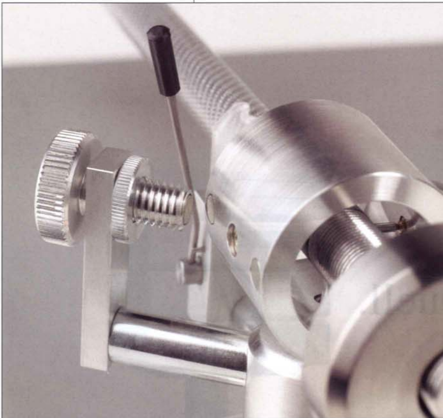
Beim Satisfy bewerkstelligen zwei in der Entfernung verstellbare Magnete die Antiskatingfunktion

rohr selbst ist neu: Seit kurzem spendiert Clearaudio dem Satisfy ein extrem leichtes und steifes Kohlefaserrohr. An dessen Ende sitzt ein Headshell, das sehr viele Freiheitsgrade beim Tonabnehmereinbau lässt: Dank der zentralen Befestigung mit einer einzigen, durch einen Schlitz im Träger gesteckten Schraube kann man sowohl Kröpfungswinkel als auch Überhang – die beiden entscheidenden Parameter bei der Abtasterjustage – in weiten Grenzen variieren.