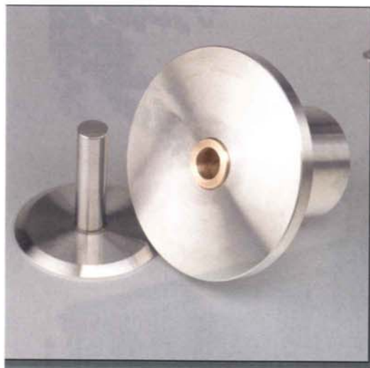
Das invertierte Ambient-Lager arbeitet mit einer gehärteten Stahlspin-del und einer in einen Edelstahlblock eingelassenen Bronzebüchse

rund 470 Ohm abschließen, das deckt sich mit unseren Erfahrungen: So tönt es am ausgewogensten.